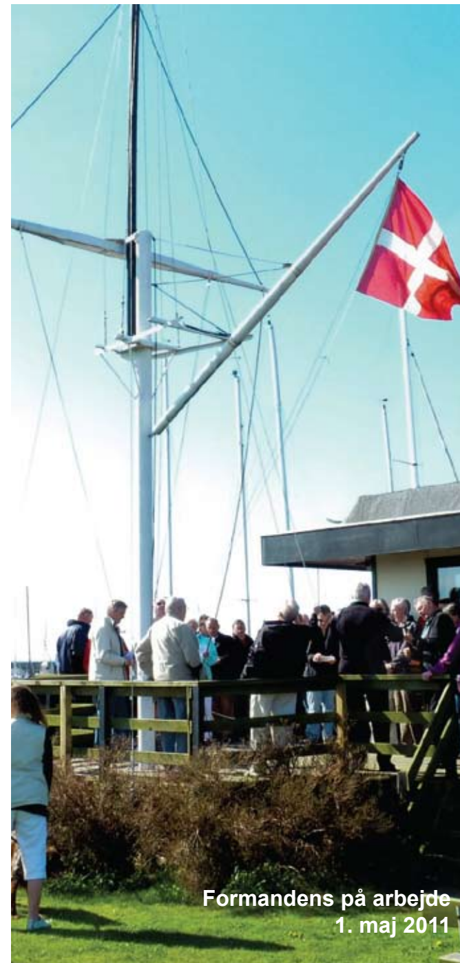
Formandens på arbejde 1. maj 2011