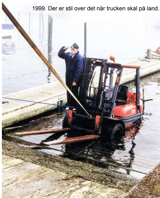
1999. Der er stil over det når trucken skal på land.