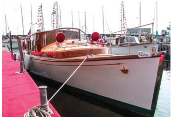
Havnefoged Per Orland