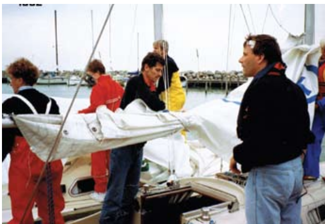
Skolebådene, instruktører og elever