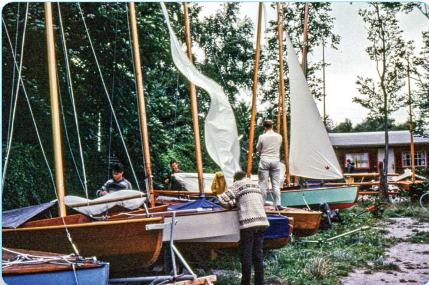
Bådene klargøres til lokal kapsejlad. Foto: Børge Carlsen, 1965.