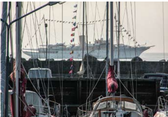
Hendes Majestæt Dronningen med følge besøger Mosede